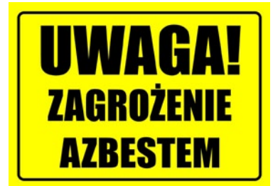
Rys. 2. Tablica informacyjna