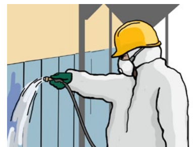
Rys. 3. Nawilżanie materiałów zawierających azbest