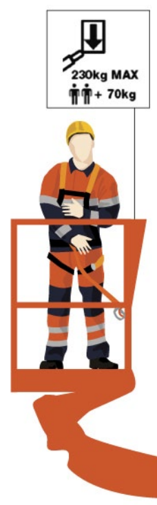
Rys. 2. Informacja o dopuszczalnym obciążeniu platformy podestu ruchomego