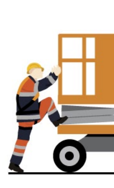
Rys. 5. Bezpieczne wchodzenie do kosza