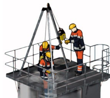
Rys. 2. Zastosowanie trójnogu ewakuacyjnego przy robotach w studzienkach kanalizacyjnych