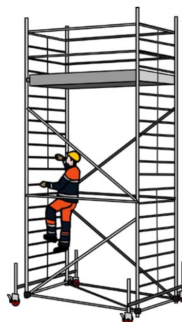
Rys. 1. Prace na rusztowaniach jezdnych