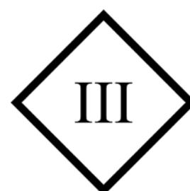
Rys. 6. Symbol urządzenia zasilanego napięciem bezpiecznym