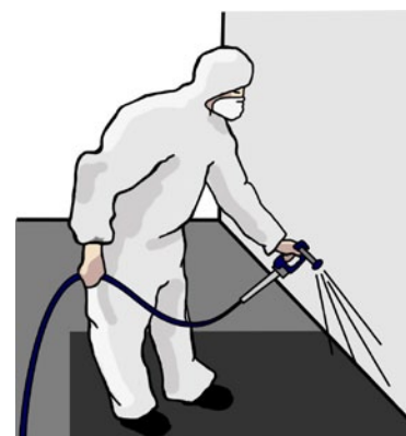
Rys. 4. Prace malarskie – ochrona dróg oddechowych