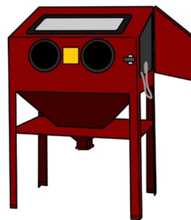
Rys. 1. Rękawy ochronne