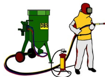
Rys. 2. Piaskowacz – wyposażenie ochronne