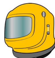
Rys. 3. Hełm do piaskowania