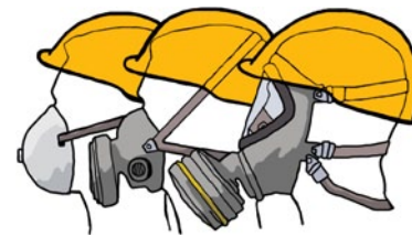
Rys. 3. Ochrony dróg oddechowych