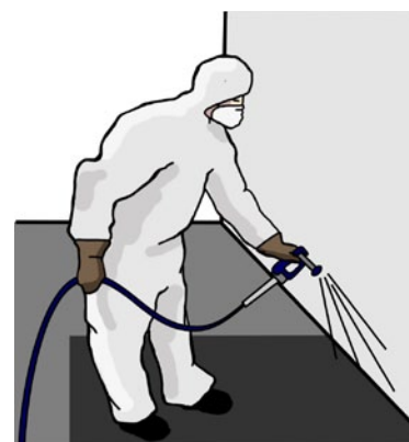
Rys. 4. Malowanie natryskowe