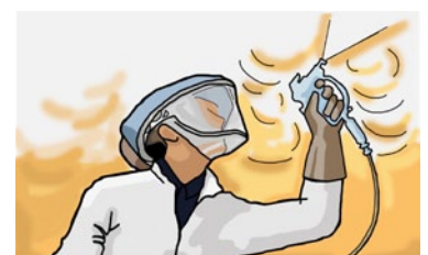
Rys. 2. Kaptur chroniący drogi oddechowe