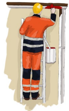
Rys. 1. Malowanie z drabiny przy utrzymaniu trzech punktów kontaktu z drabiną