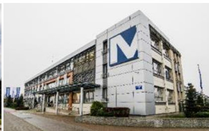
Siedziba Mostostal Płock S.A.

Spółka Dominująca Mostostal Warszawa S.A. jest jedną z największych firm budowlanych w Polsce. Mostostal Warszawa S.A. jako generalny wykonawca realizuje inwestycje we wszystkich kluczowych sektorach rynku budowlanego w kraju. 80 lat obecności firmy na polskim rynku zaowocowało realizacją wszelkiego rodzaju obiektów z zakresu budownictwa: ogólnego, przemysłowego, energetycznego, infrastrukturalnego i drogowego oraz ekologicznego. Przez lata aktywności Spółka Dominująca zdobyła szerokie doświadczenie w tworzeniu konstrukcji stalowych i instalacji technologicznych dla przemysłu petrochemicznego i chemicznego. W swoim działaniu Mostostal Warszawa S.A. łączy wieloletnią tradycję polskiej myśli inżynierskiej z wykorzystaniem najnowocześniejszych technologii.