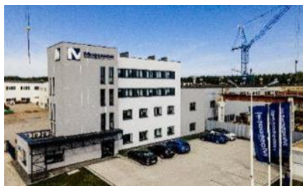
Siedziba Mostostal Kielce S.A.