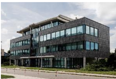
Siedziba AMK Kraków S.A.