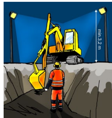
Rys. 5. Oświetlenie placu budowy