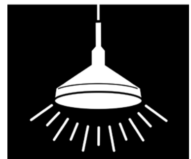
Rys.3. Oprawa przy oświetleniu pośrednim