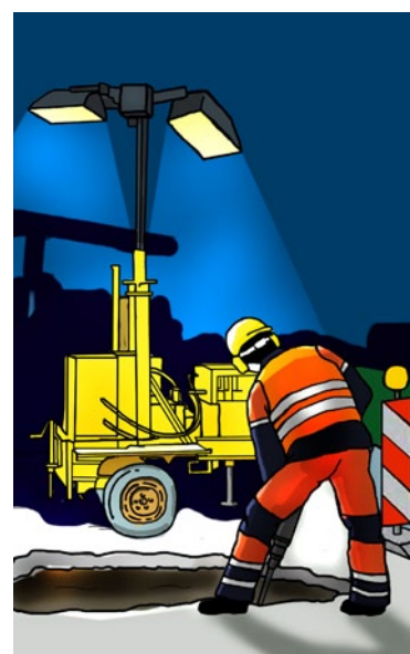
Rys. 6. Oświetlenie na statywach