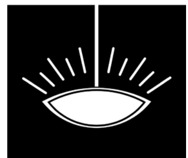
Rys. 2. Oprawa przy oświetleniu bezpośrednim