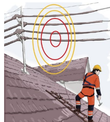
Rys. 1. Strefy prac pod napięciem i w pobliżu napięcia