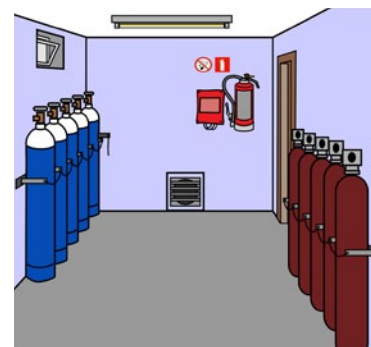
Rys. 3. Magazyn gazów technicznych