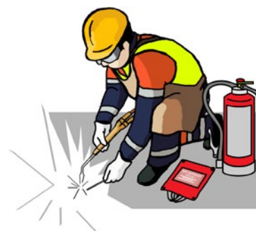
Rys. 2. Ruchome stanowisko spawalnicze