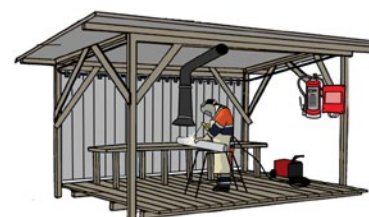
Rys. 1. Stanowisko spawalnicze na otwartej przestrzeni